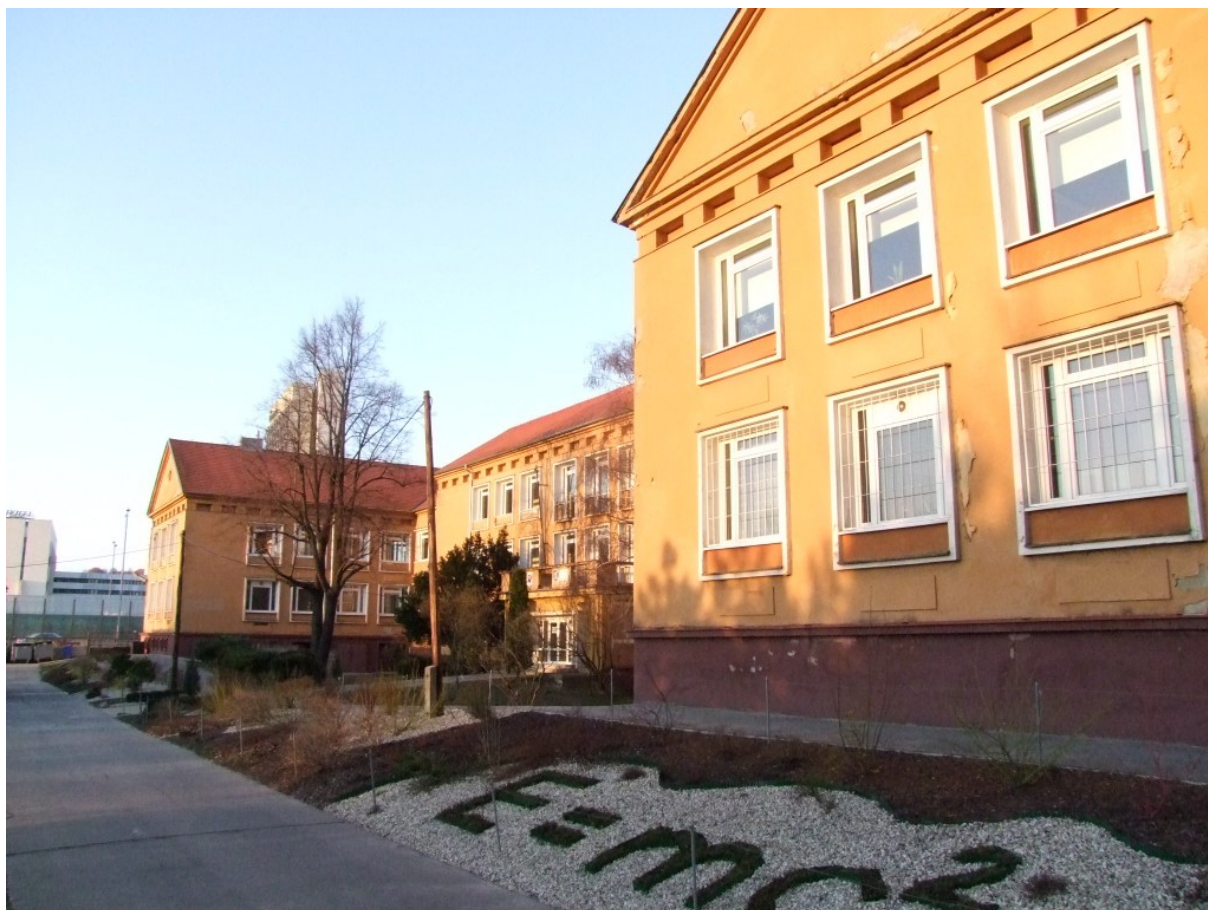
prístavok školy – súp.číslo 3513